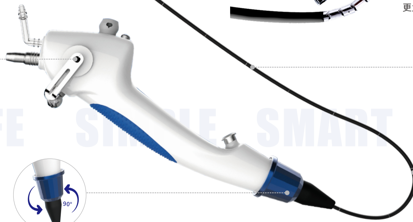
铆接蛇骨 Riveted snake bone